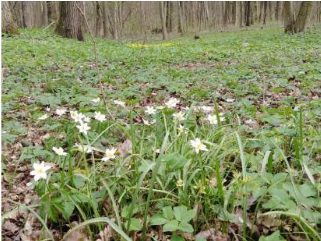
Ветреница дубравная и гусиный лук